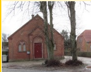
Før renovering i 2016