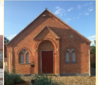
Efter renovering i 2016

Fra Marmrelund til Bystedet – et hus i Gullev fylder 120 år