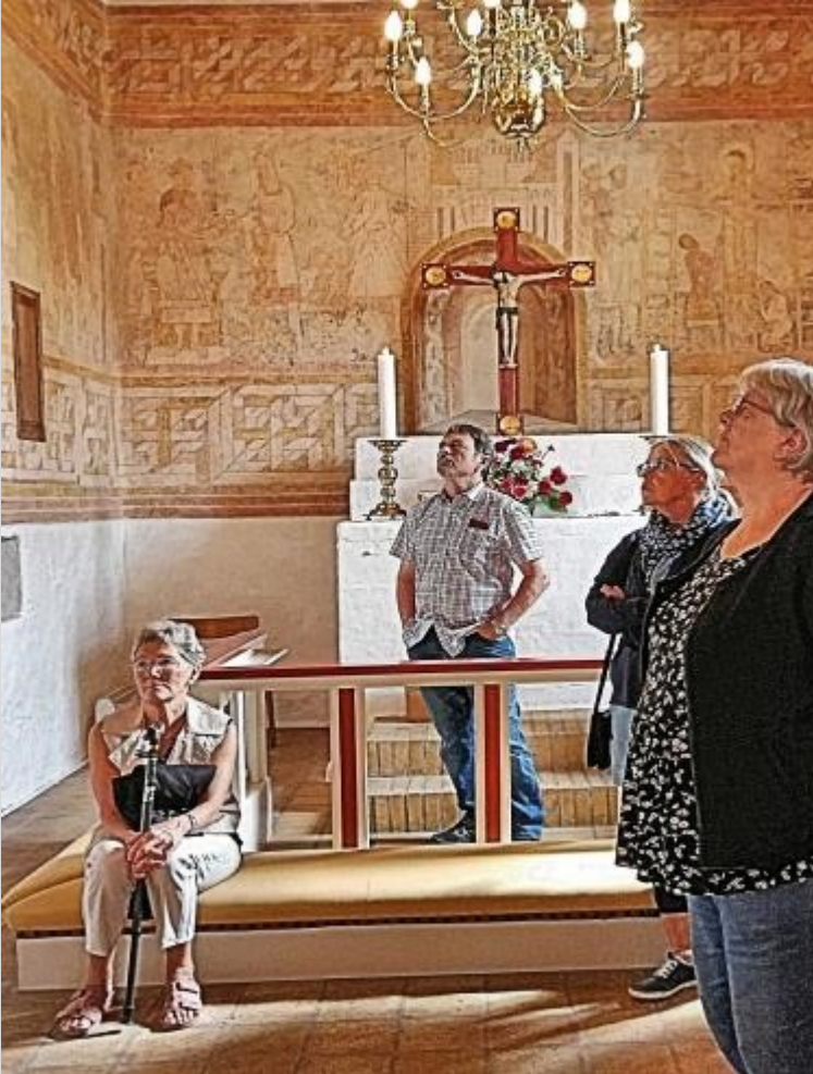
Fra sogneudflugt d 18. august – I Råsted Kirke så vi kalkmalerier fra ca 1125, som fortalte historien om Jesus fra fødsel til død. Derefter gik turen til Hvidsten Kro.