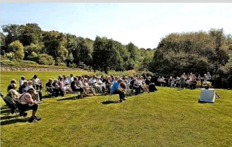
Fra friluftsgudstjeneste d 25. august – Mange havde fundet vej til Ormstrup, hvor vi nød en varm sensommereftermiddag med gudstjeneste, musik og kaffe i haven.